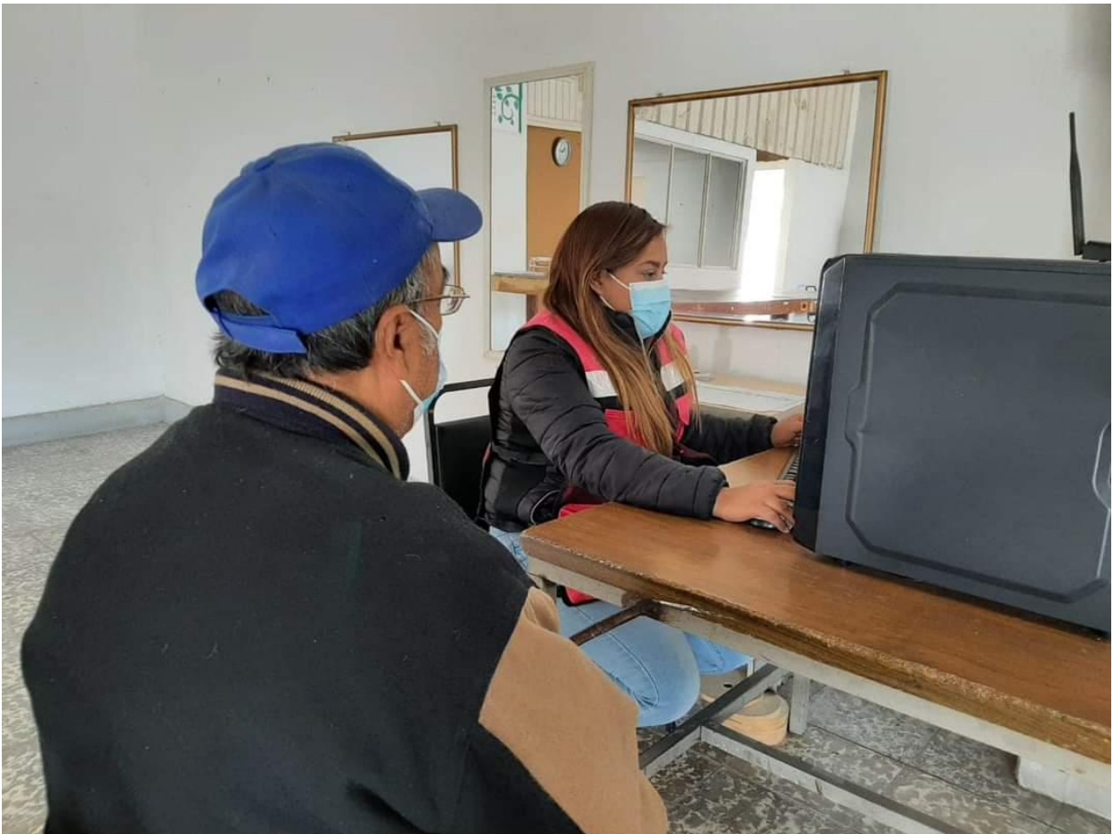
Se inicia registro de adultos mayores para la vacuna Covid-19,